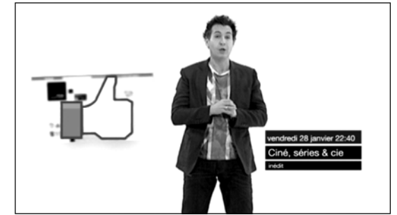
Bande-annonce « Ciné, Séries & Cie » (Orange, 2011)